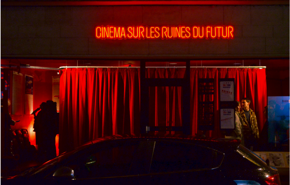
Figure 4 : Cinéma sur les ruines du futur. Interventions urbaines dans le cadre d'un travail autour de l'urbanisme Utopique mené avec des sans-abris, des chômeurs et des Voyageurs, à Rouen et Sotteville-lès-Rouen.