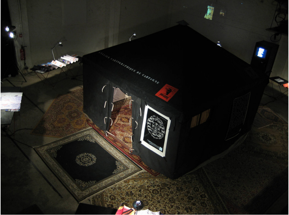
Figure 3: SMALA. Atelier d'urbanisme et cartographique, à Pau, sur les pas de l'émir-architecte Abd el-Kader. © Échelle Inconnue.