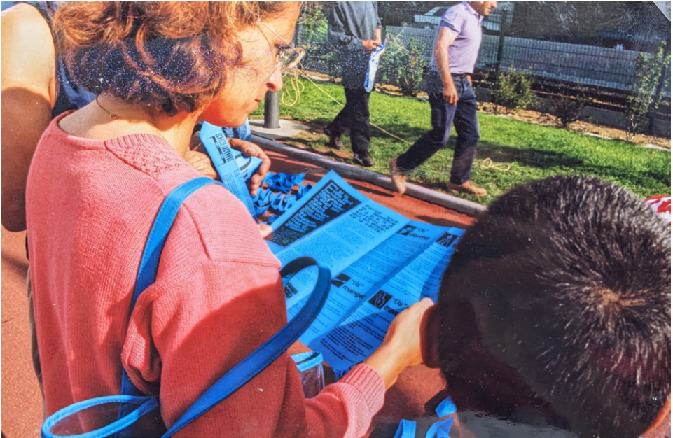
Figure 1: Manoeuvre urbain, Échelle Inconnue, Armada de Rouen, 1999. © Échelle Inconnue.