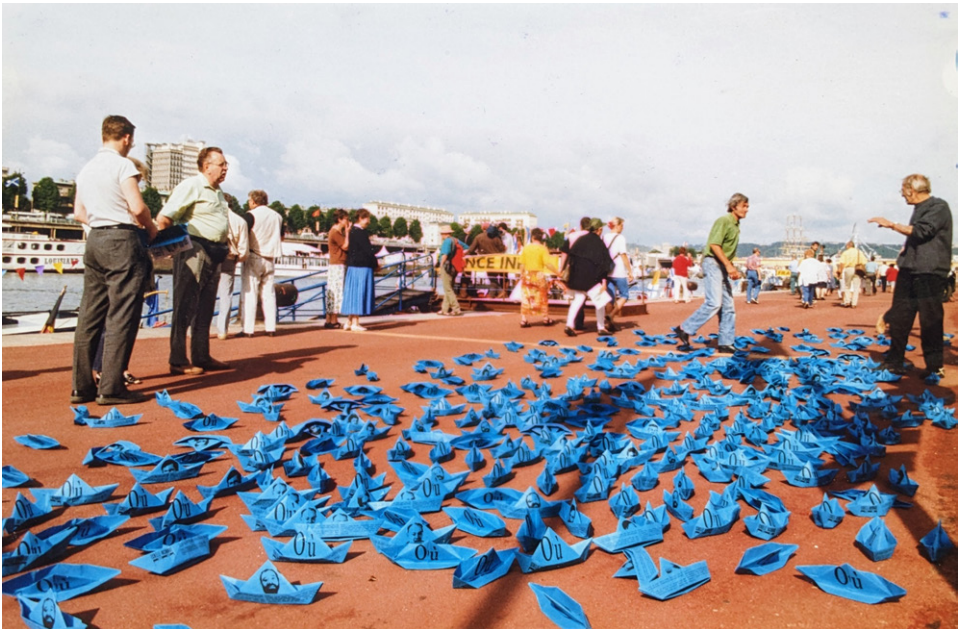
Figure 2: L'Armada d'Échelle Inconnue, 1999. © Échelle Inconnue.