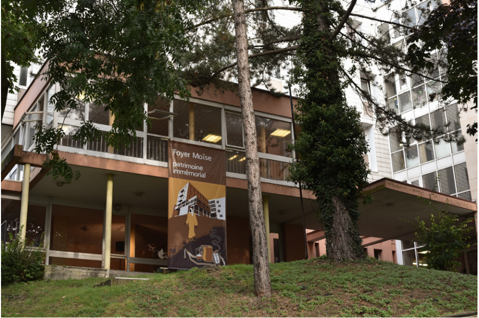
Figure 5: Façade du Foyer Moïse, à Rouen, à l'occasion des Journées européennes du Patrimoine 2024.