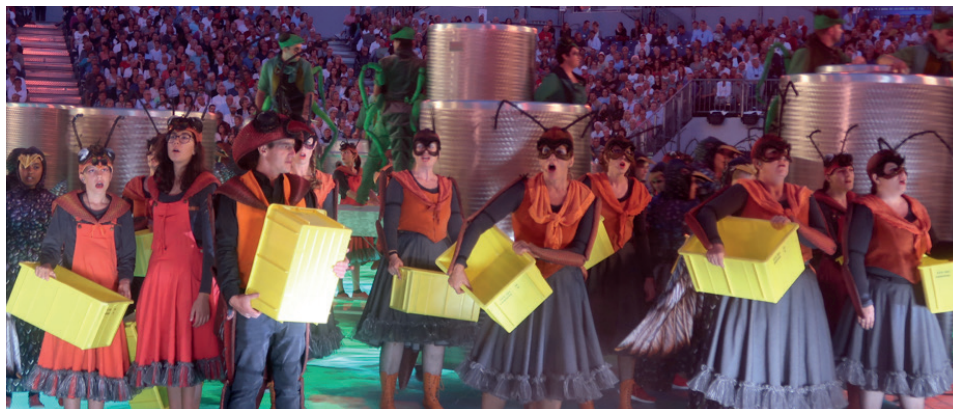
Figure 2 : fourmis choristes

l'un à l'autre. L'apparence visuelle et le son entrent également en tension avec la sonorisation des cors des Alpes. Le metteur en scène refusant les micros posés sur scène, les sondeur·ère·s re-conçoivent l'équipement et fixent des micros sur les instruments, mais, ne disposant plus de micros sans-fil, les musicien·ne·s doivent s'adapter et emmener avec eux câbles, micro et cor lorsqu'ils entrent et sortent de scène.