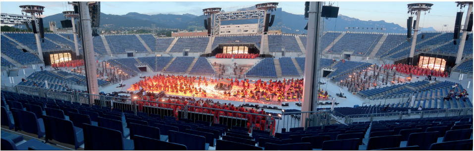
Figure 1 : l'espace scénique de l'arène 2019

Le nouveau régime de sensibilité sonore se caractérise alors par deux critères : l'intelligibilité et l'émotion induite par le son. Musique et textes doivent être clairement perçus, audibles et compréhensibles, ce qui doit être assuré par la qualité de la composition et du texte, et le travail des interprètes, mais aussi par la sonorisation. La faisabilité acoustique du spectacle est alors évaluée en priorité ; la conception du spectacle en dépend. Par ailleurs, l'écoute a pris de l'importance ; le public voyant désormais avec les oreilles 7 , le son doit pouvoir attirer son attention sur ce qui se passe et là où ça se passe, sans quoi l'émotion serait perdue 8 . La Fête est une affaire de son, pas seulement de musique.